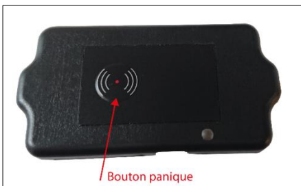
Boîtier GPS, GSM/GPRS